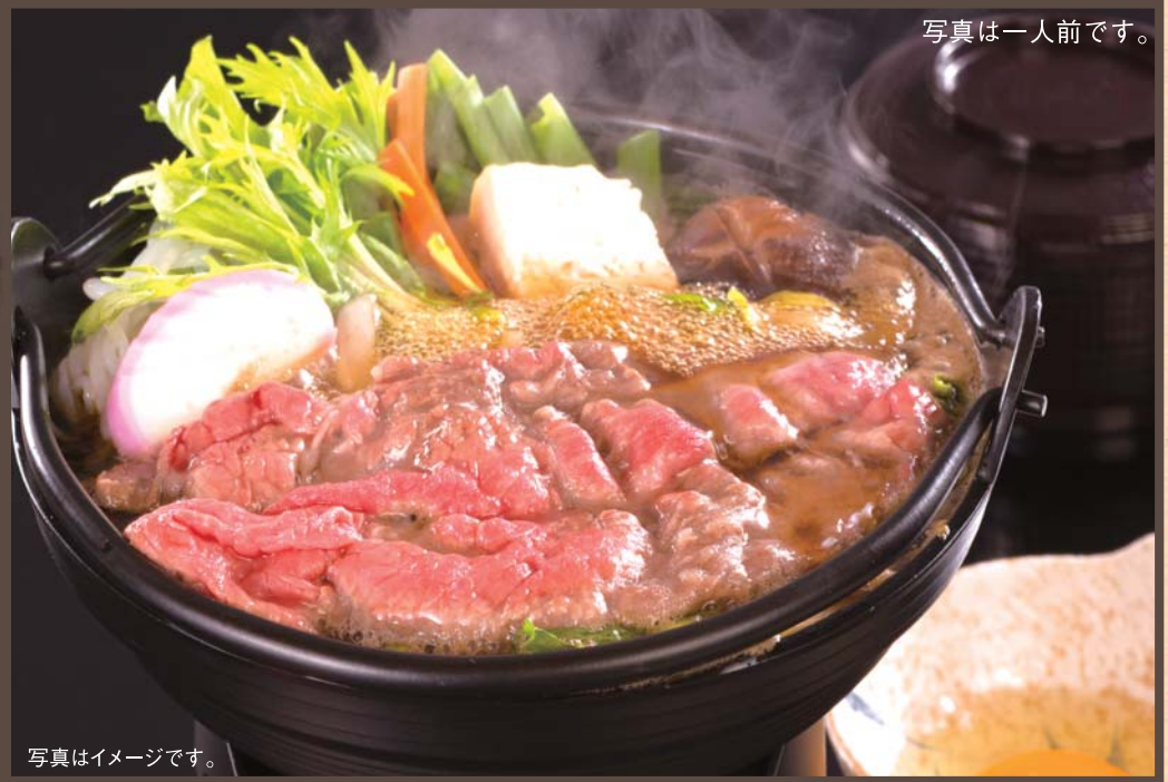
写真は一人前です。