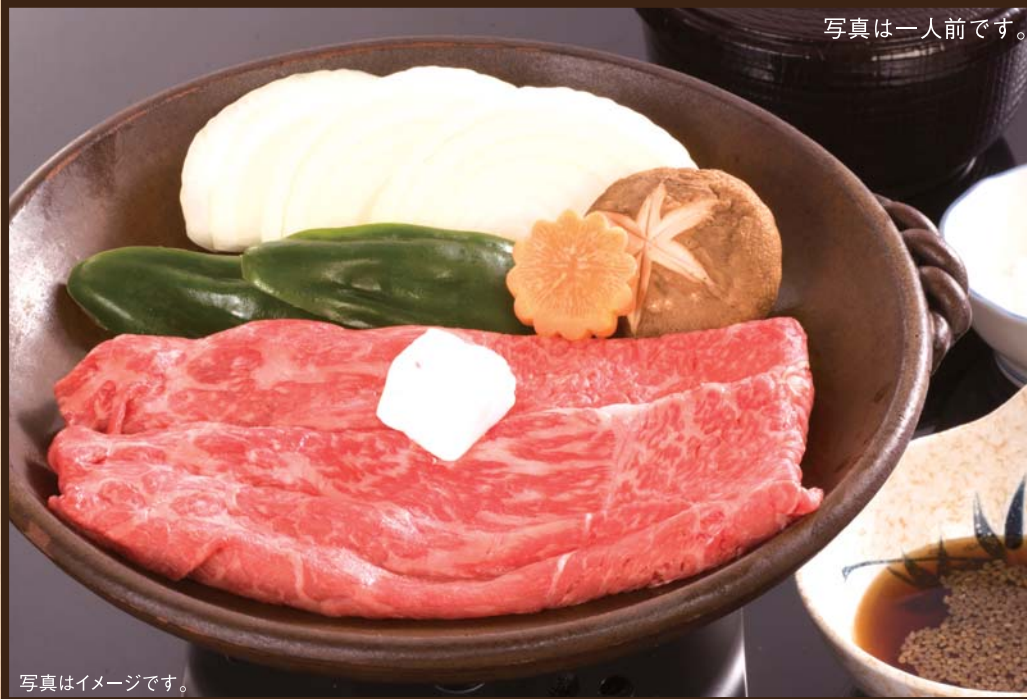
写真は一人前です。